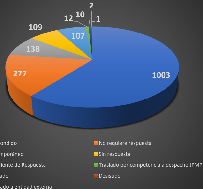
Estados de respuesta

En el periodo del actual reporte, la UAEJPMP no registra solicitudes a las que se les haya negado información.