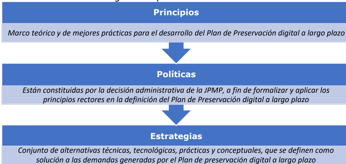
Ilustración 3. Elaboración propia con base en la Guía para la gestión de documentos y expedientes electrónicos. https://mineducacion.gov.co/1780/articles-409158_recurso_23.pdf

El enfoque con que se desarrolla el Plan de Preservación Digital a Largo Plazo está sustentado en los siguientes pilares: