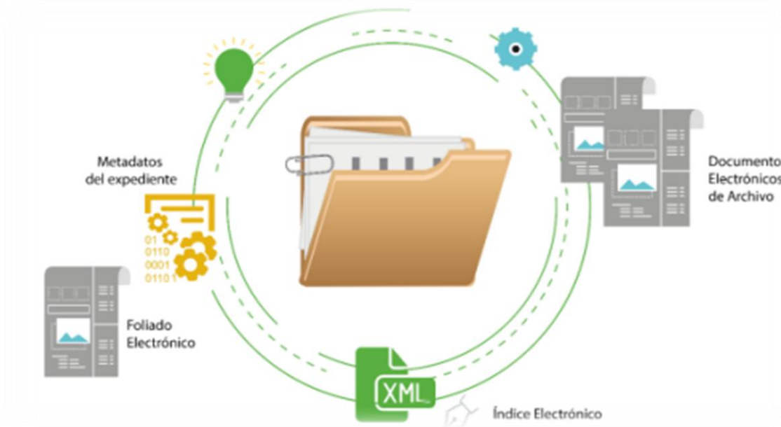
Ilustración 1 recuperada del plan de preservación digital del ministerio de educación Nacional (2022). Pág. 21.

En el ámbito digital, a diferencia del entorno físico en papel, la conservación y la implementación de un plan de preservación, requiere que los elementos que conforman el documento electrónico (que son de variada naturaleza) mantengan su valor como evidencia auténtica y, al mismo tiempo, reflejen de manera contextual las circunstancias de su creación. Además, deben vincularse con otros documentos que den cuenta de las funciones que les dio origen. Esta perspectiva implica que, como mínimo, existen dos entes con sus respectivos componentes que deben ser objeto de conservación digital a largo plazo: el documento electrónico y el expediente electrónico.