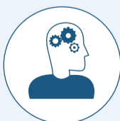
Gestión del Conocimiento