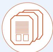
Información y Comunicación