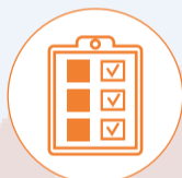
Evaluación de Resultados