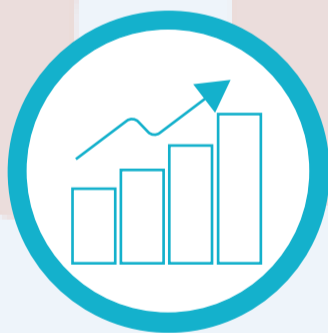
Gestión con Valores para Resultados